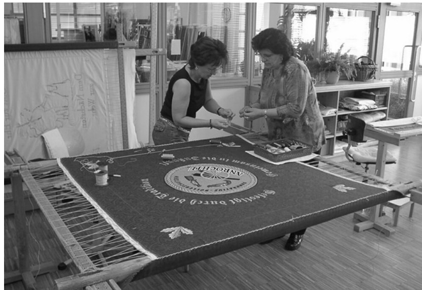
Abb. 3: Die Fertigung der Vereinsfahne bei einem bayerischen Fahnenhersteller

Anlässlich des 1. Anröchter Böllertreffen 2003 wurde beschlossen eine Fahne in Auftrag zu geben. Am 27. Juni 2003 wurde die Fahne geweiht und konnte zum ersten großen Fest der Pankratius Böllerschützen am 09. August 2003 der Öffentlichkeit vorgestellt werden.