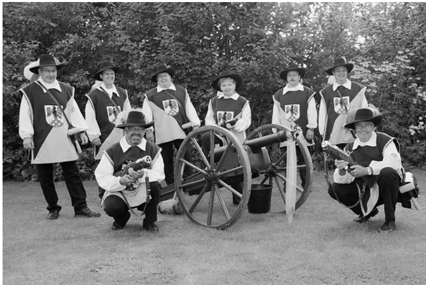
Abb. 2: Die Anröchter Böllerschützen mit ihrer Kanone, die beim Männerschützenfest 2001 zum ersten Einsatz kam

Am 05.02.2002 wurde beschlossen die Pankratius-Böllerschützen als eigenständigen Verein zu melden.